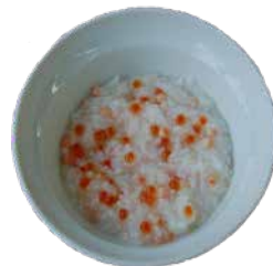
イクラ入りおかゆ