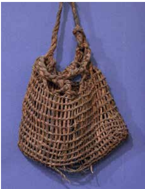
あ ぶくろ 編み袋