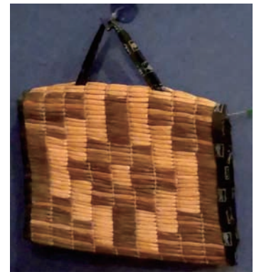
せい ガマ製かばん